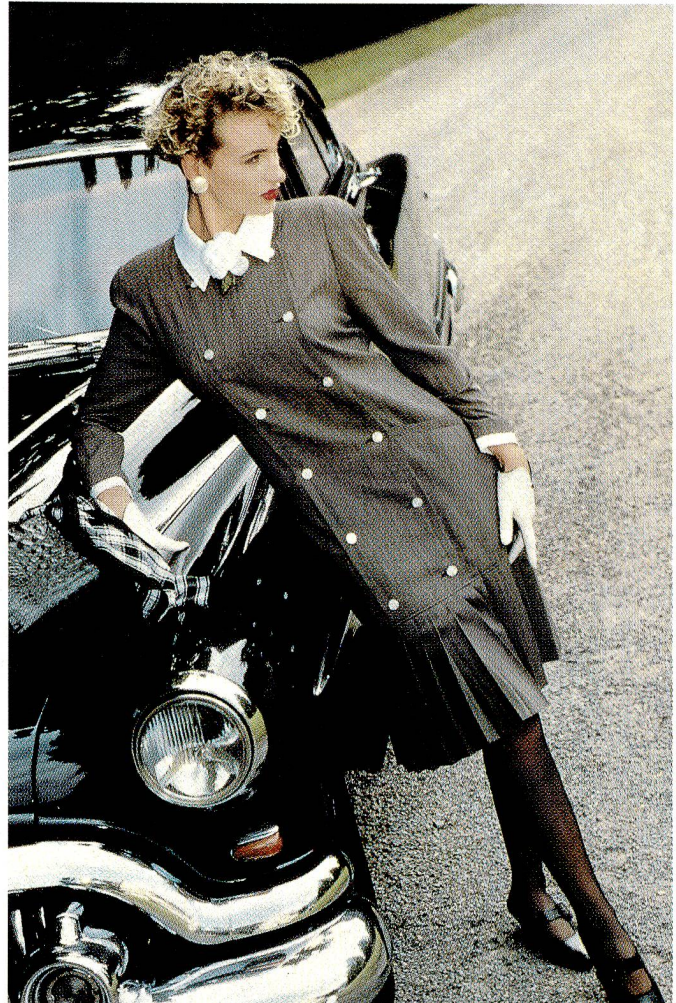
Retro à la Hollywood von Janina Schreck. Kleid, reine Schurwolle.

Zur Feldpausch Farbpalette: Die neue Saison beginnt mit verhaltenen, warmen Tönen und wird durch farbige Akzente aufgehellt.