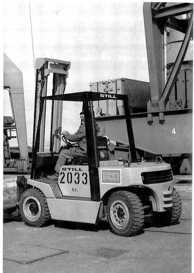
Ein Fahrzeug aus der R 70 von Still. Viel Platz und Fussfreiheit für den Fahrer, nicht nur am Arbeitsplatz, sondern schon beim Aufstieg aufs Fahrzeug.

Verletzungen der Gabelstaplerfahrer beim Auf- oder Absteigen vom Fahrzeug sind weit verbreitet. Das beweisen Unfallstatistiken aus dem In- und Ausland immer wieder von neuem. So werden in der Bundesrepublik Deutschland etwa 1200 Unfälle pro Jahr gemeldet, womit dieser Unfalltyp mit rund 10% aller gemeldeten Staplerunfälle an dritter Stelle in der Statistik liegt.