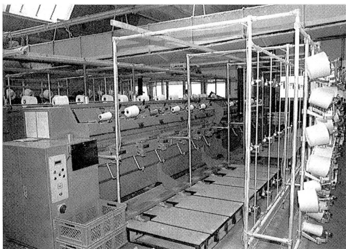
Präzisionsspul- und Fachmaschine mit 6 Spulstellen je Maschine

Neben diesen Spezialitäten werden in der DD-Zwirnerei Glattzwirne, bis 12fach Zwirn, hergestellt. In diesem Bereich werden abgelängerte Konen (+/-0,5 CV%), grösste Längen ohne Knoten (bei Nm 50/2 bis zu 1,7 Kilo) und gespulte Färbekonen angeboten. Die neue Doppeldrahtzwirnerie (Saurer-Allma) sowie die Präzisionsspul- und Facherei (Schärer) wurden bereits vor gut zwei Jahren in Betrieb genommen.