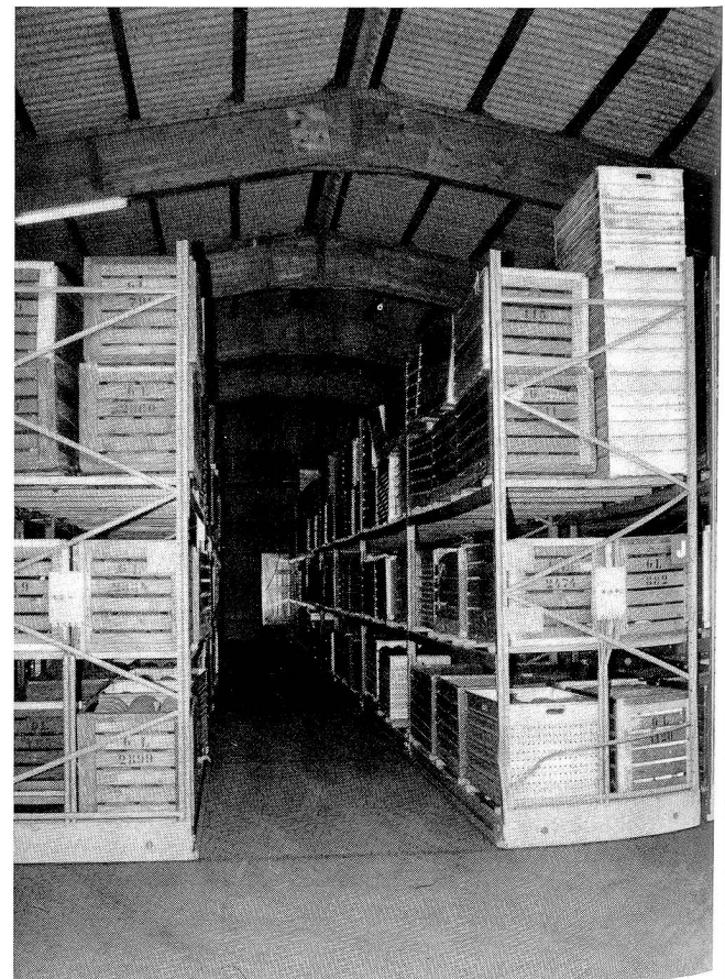
Blick ins Garnlager. Die einzelnen Regale werden auf Schienen bewegt. Das Ergebnis ist eine Platzeinsparung von 50% in der Lagerhalle.

Der EDV-Einsatz durchdringt die ganze Unternehmung. Ohne Computer geht nichts. Seit 1970 wird dies konsequent verfolgt. Der Logistik wird in der Bleiche der gleiche Stellenwert zugemessen wie etwa Verkauf und Produktion. Diese Abteilung garantiert, dass die Überwachung auf jeder Stufe reibungslos funktioniert. Angestrebt wird zum Beispiel eine 100%ige Einhaltung der Termine. Aufträge, die ab Lager geliefert werden können, werden noch am gleichen Tag speditiert. Grundlage für den prompten Service ist der rigoros eingehaltene Belegungsplan für alle Produktionsstufen. Als wichtig erachtet Heinz Iseli auch die Kundeninformation: Kommt es zu Termenschwierigkeiten, sei es immer besser, den Kunden zu informieren, als darauf zu warten, dass hoffentlich nichts passiert.