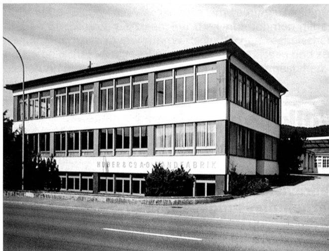
Die Grundfläche der Fabrikliegenschaft beträgt um die 2000 m 2 .

Besonderes Know-how, das im Verlauf der Jahre seit Aufnahme der Lamellentragband-Produktion im Jahre 1961 erworben wurde, mündete in ein gegenwärtig weltweit singuläres und unter Anwendung einer selbst entwickelten Technologie fabriziertes Erzeugnis der Bandweberei. Unter den markenrechtlich geschützten Bezeichnungen «Texband», «Hagofix» und «Hagotex» werden Trag- und Aufzugsbänder für die Storenhersteller mit einzigartigen Eigenschaften produziert. Beim «Texband» (Aufzugsband) wird das 0,27 oder 0,33 Millimeter breite, auf Schifflimaschinen gewobene Band mit einer Beschichtung ummantelt, um ein Aufscheuern beim Gebrauch zu verhindern. Für einen störungsfreien