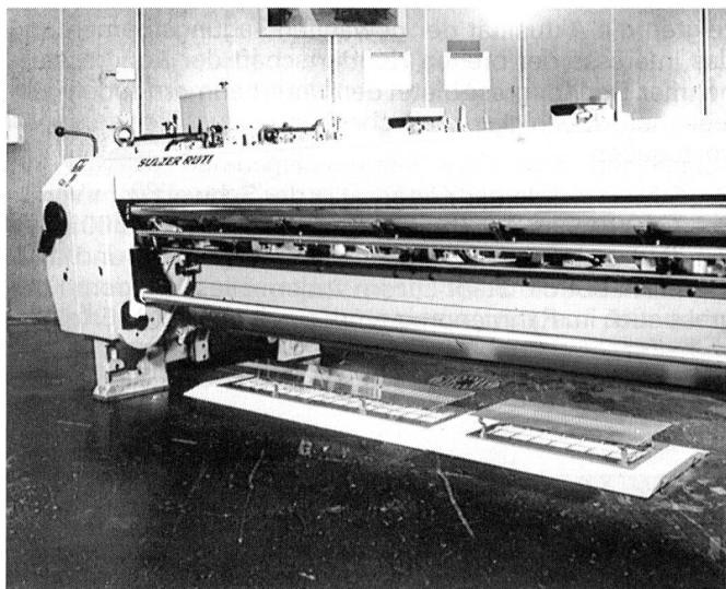
Webmaschine mit Bodenluftauslass für die Arbeitszonenklimatisierung

Dieser Luftstrom lässt sich besser regeln und mit geringerem Energieverbrauch erzeugen. Die Halle wird dann von der Luft ausreichend klimatisiert, die aus der Arbeitszone aufsteigt. Der spezielle Vorteil besteht darin, dass die Luftfeuchte auf