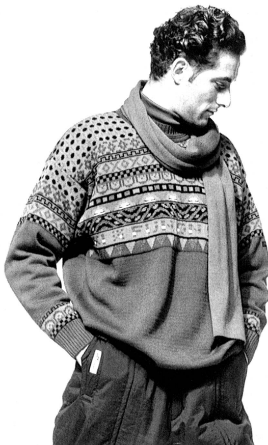
Winter 1989/90: Wollsiegel alpin. Schurwolle, die ideale Faser für den Wintersport. Ideenreiches, witziges Norweger Design mit modernen Stilelementen zeigt dieser sportive Wollsiegel-Skipullover von Steffner-Sportswear, Ennsparck, A-5541 Altenmarkt.

Wenn das österreichische Ski-Nationalteam des Skizirkus jetzt wieder an den Start geht, dann tut es dies in rot-weissen Slalom-Pullovern aus reiner Schurwolle. Und mit ihnen elf weitere Nationalmannschaften, die ebenfalls beim sportlichen Wettstreit auf die Wollsiegel-Qualitäten der österreichischen Strickwarenhersteller setzen.