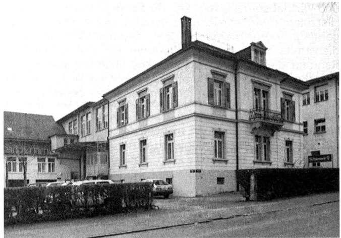
Erneuert und à jour gebracht: Firmensitz in Kreuzlingen.

50 Mio. Teilen jährlich in der Bundesrepublik Deutschland Marktleader, 90% des Umsatzes (1987: 484 Mio. DM) werden dort erzielt. Etwas weniger bekannt im Vorstufenbereich ist, dass das Unternehmen in der Schweiz auch über eine Tochtergesellschaft verfügt, die Schiesser und Scherrer AG an der Hafenstrasse in Kreuzlingen, der wir uns im Rahmen der Serie «mittex-Betriebsreportage» zuwenden.