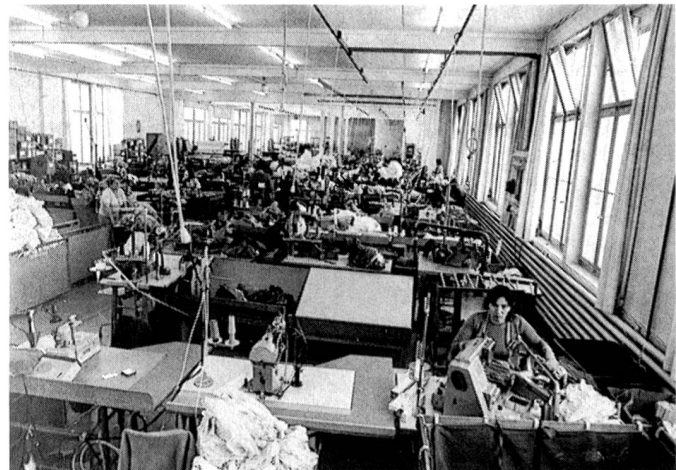
Im Nähsaal der Schiesser und Scherrer AG wird auch für das Mutterhaus gefertigt.

Die heutige Schiesser und Scherrer AG, die 1987 auf einen Umsatz von 10,2 Mio. Franken kam, ist auf dem schweizerischen Markt für den Verkauf und den Vertrieb des gesamten Programms der Schiesser-Gruppe verantwortlich, d.h., neben den in der eigenen Produktion mit 77 Beschäftigten (plus 20 Beschäftigte für Verwaltung und Vertrieb) gefertigten Sortimenten wird auch das aus den übrigen Betrieben des Mutterhauses stammende Angebot dem einheimischen Detailhandel verkauft. «Schiesser»-Maschenwaren sind ausgesprochene Markenartikel, was ebenfalls als