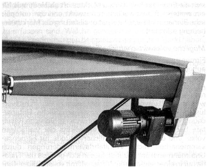
Bei der Ammercurve sind verschiedene Antriebsarten möglich. Auffällig ist die durchdachte Konstruktion.

Raumersparnis, grosse Betriebssicherheit, universelle Einsatzmöglichkeiten sowie geringe Wartungs- und Betriebskosten sind die ausschlaggebenden Merkmale dieser modernen Kurvengurtförderer.