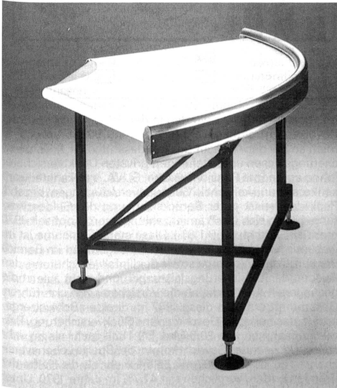
Raumsparender und sehr betriebssicherer Kurvengurtförderer mit universellen Einsatzmöglichkeiten.

Raumersparnis, grosse Betriebssicherheit, universelle Einsatzmöglichkeiten sowie geringe Wartungs- und Betriebskosten sind die ausschlaggebenden Merkmale dieser modernen Kurvengurtförderer.