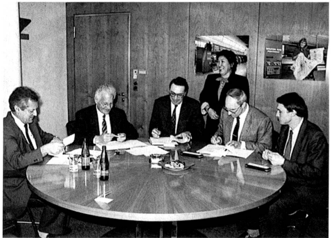
Unterzeichnung des Liefervertrages über 36 Gross-Stickmaschinen Saurer 1040 Pentamat, mit 15 Yards Sticklänge sowie Peripherie-Anlagen und Stickmaschinenzubehör in Arbon.

Am 30. März 1989 wurde in Arbon zwischen der Technopromimport, Moskau, und der Saurer Textilmaschinen AG der Vertrag über die Lieferung von 36 Gross-Stickmaschinen Saurer 1040 Pentamat, mit 15 Yards Sticklänge, unterzeichnet.