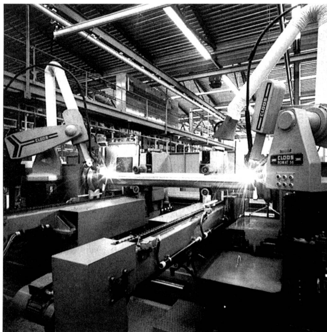
Sulzer-Rüti-Teilfamilie Walzen: Schweissanlage mit zwei Robotern zum Anschweissen der Walzenboden

Zu den Unternehmen, die bei Sulzer Rüti ebenfalls grössere Maschinengruppen bestellt haben, gehören die Firma G. A. P. (Ortadogu Tekstil A.S.) in Malatya, die 48 Projektwebmaschinen, Maschinen mit Schussmischer und Vierfarbenmaschinen mit einer Nennbreite von 390 cm mit Exzentermaschine, in Auftrag gegeben hat, und die Firma Kipas in Kahraman Maras, die 82 Projektwebmaschinen, Maschinen mit Schussmischer mit einer Nennbreite von 360 cm mit Exzentermaschine, bestellt hat. Beide Unternehmen verarbeiten Baumwolle zu hochwertigen Oberbekleidungsstoffen.