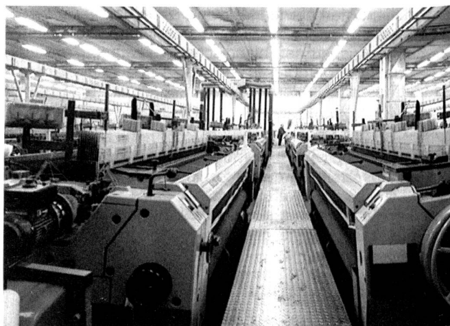
Blick in die Webmaschinenanlage der Firma Orta Anadolu in Kayseri mit Sulzer-Rüti-Projektwebmaschinen des Typs P 7100

Die Gründung der EMS-Far Eastern Ltd. bringt EMS eine optimale Nutzung des Produkte- und Anwendungs-Know-how in Fernost und dient dem Ausbau der langfristigen Sicherung der weltweiten Marktstellung für polymere Werkstoffe. Für Far Eastern Textile Ltd. ist diese Kooperation ein weiterer Schritt in Richtung der erfolgreich eingeschlagenen Diversifikation in technische Produkte und deren Märkte.