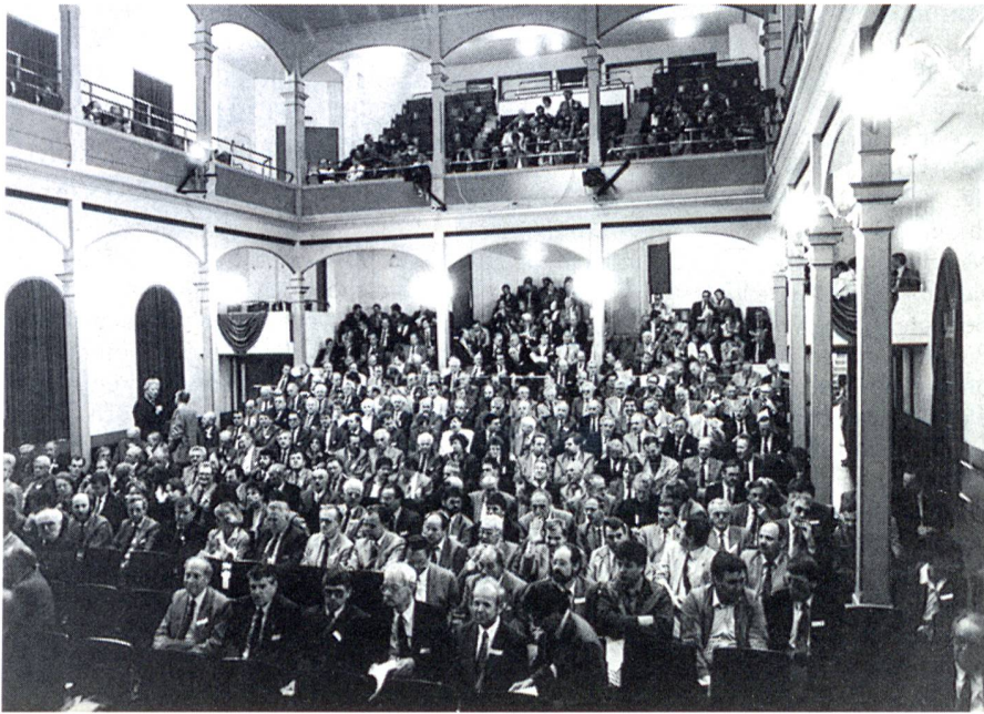
Volles Haus in der ehrwürdigen Tonhalle von Wil. 424 Mitglieder und 20 Gäste besuchten die Generalversammlung im schönen Ostschweizer Städtchen.