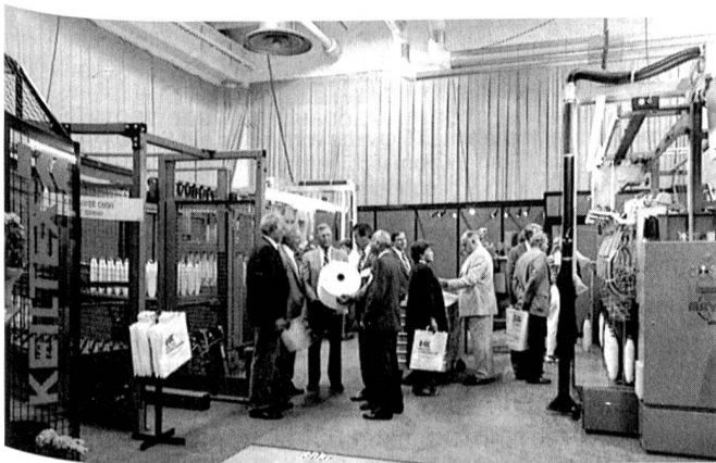
Blick auf den Mayer-Ausstellungsstand während der ATME-I '89

Die neuen Kreuzspul-Fachautomaten werden zur Zeit bereits in der amerikanischen Teppichindustrie installiert, so dass die ersten Rationalisierungseffekte schon in nächster Zeit eintreten werden.