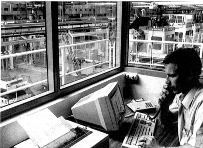
Sulzer Rütli: Leitstand eines flexiblen Fertigungssystems.

Das Produktionskonzept Webmaschinen führt bis 1992 zu einer bedeutenden Neuausrichtung der Produktionswerke. Neben der Einführung der flexiblen Fertigung in Rütli und Zuchwil werden für geeignete Einzelteile und Komponenten vermehrt auswärtige Beschaffungsmöglichkeiten miteinbezogen. Für die Realisierung dieses Konzeptes investiert Sulzer Rütli im Zeitraum von 1987 bis 1992 insgesamt rund 300 Millionen Franken. Dies soll auch in Zukunft die wirtschaftliche Herstellung und den hohen Qualitätsstandard der Webmaschinen garantieren. Damit werden die Auslastungsschwankungen reduziert, der «Make or Buy»-Entscheid erleichtert und somit die bestmögliche Flexibilität hinsichtlich Produktemix gewährleistet.