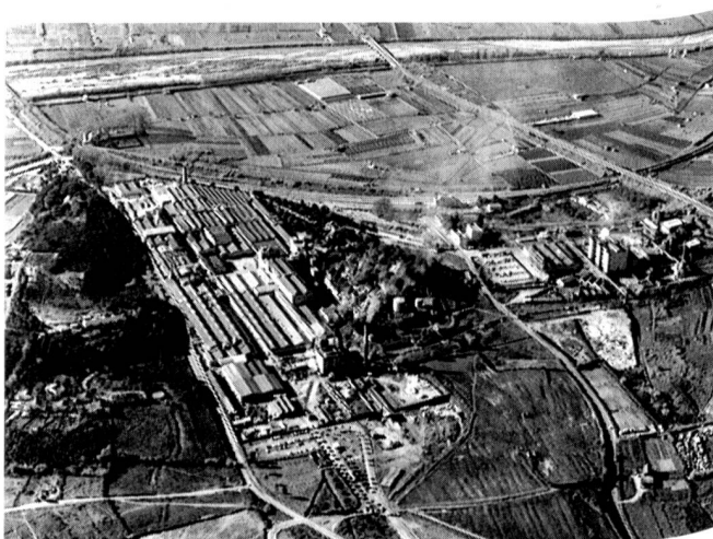
Luftaufnahme des Werkes in Blanes.

Im Rahmen ihrer europäischen Faserpolitik hat Rhône-Poulenc eine bedeutende finanzielle Stärkung der SAFA (S. A. de Fibres Artificiales) beschlossen.