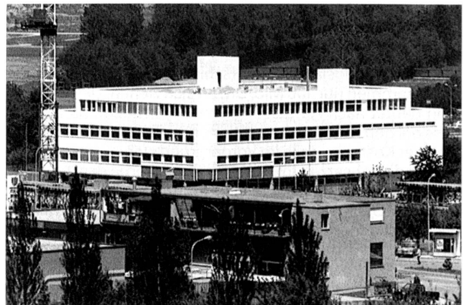
Das neue, moderne Gebäude, in dem sich das Verkaufsbüro der Landis & Gyr für den Bereich Steuer-, Leit- und Regeltechnik in Chur befindet. Das nun erweiterte Verkaufsnetz der Schweiz gewährleistet eine kundennahe Unterstützung für Verkauf, Service und Engineering.

Der Bereich Steuer-, Leit- und Regeltechnik für Heizungs-, Lüftungs- und Klimatechnik sowie Gebäude-Management der Landis & Gyr baut seine dezentralisierte Verkaufsorganisation in der Schweiz weiter aus. Von den bereits bestehenden Niederlassungen in der Schweiz ist neu das Verkaufsbüro Trimmis nach Chur verlegt worden. Dies erfolgte aus dem Bedürfnis, die Kapazität von Verkauf, Service und Engineering der gestiegenen Nachfrage und dem wachsenden Geschäftsvolumen anzupassen.