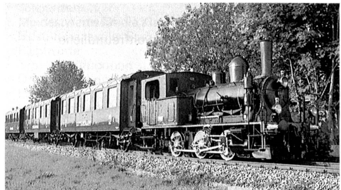
Dampflok E 3/3 (Baujahr 1910) mit drei Gotthardbahn-Wagen. Der Dampfzug fährt ab Samstagern in Richtung Pfäffikon/SZ, dann über den Seedamm nach Rapperswil und anschliessend das rechte Zürichseeufer entlang bis Schmerikon, der letzten Ortschaft am oberen Ende des Zürichsees.

Eine wirklich glanzvolle Idee hatte die Seidenfirma AG Trudel, als sie aus Anlass des 75-Jahr-Jubiläums ihre Geschäftsfreunde zu einer nostalgischen Bahnfahrt von Samstagern nach Schmerikon und zurück einlud. Höhepunkt dieser 75-Jahr-Geburtstagsfeier war das im Zug herrlich zubereitete Festessen. Der prächtige Sommerabend (16. Juni 1989) trug zu einer frohen Stimmung bei, nur allzu schnell war leider die Jubiläumsfahrt zu Ende.