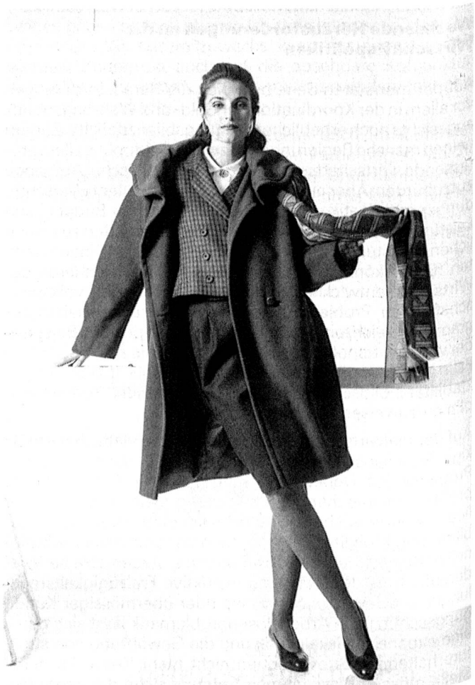
Exklusive Kombination von Mabb, Jacke, Jupe, Mantel Feldpausch Zürich

Unter dem Namen «Hunting Chic» präsentiert sich feminin-sportliche Mode in edlem Jagdstil. Hochwertige Stoffe in Tweed-Optik und Shetlands betonen dieses Bild. Wunderschöne Töne in den Farben des Waldes, reifer Früchte oder schweren, dunklen Weines werden nach neuem Farbverständnis, innerhalb einer Farbfamilie kombiniert. Hell mit Dunkel, kalte mit warmen Tönen.