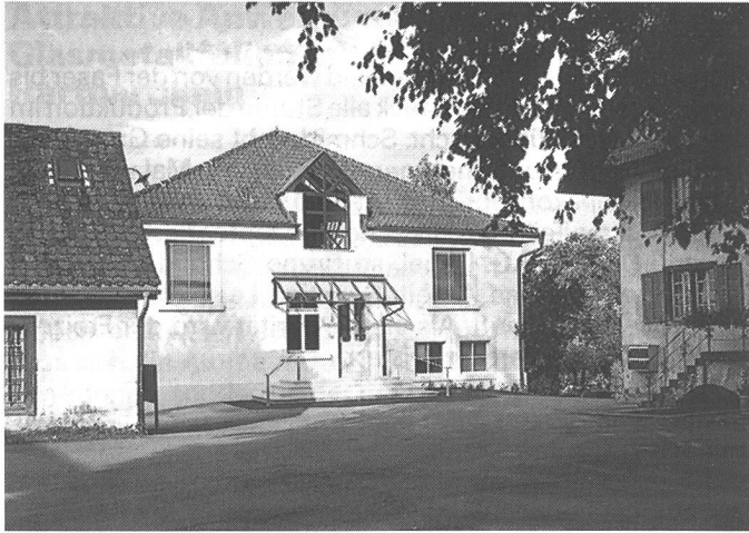
Das Stammhaus der Stehli-Unternehmen in Obfelden.