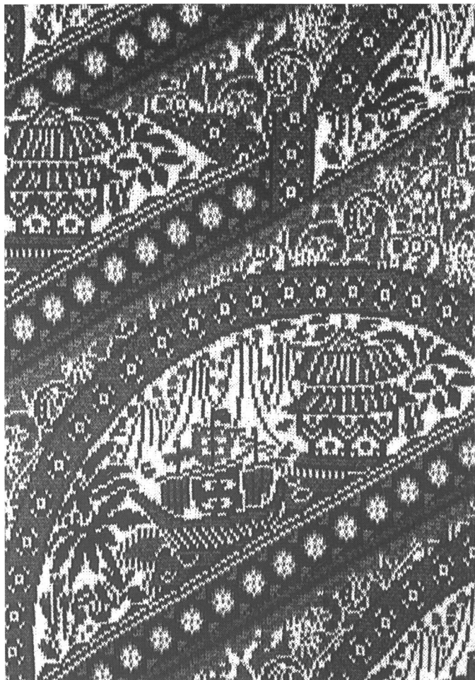
Abb. 5: «Fernöstliche Folklore». Im Ansatzpunkt dunkle Farben und Dessinierung bestimmen das Thema China. Ein ausdrucksstarkes, markantes, vierfarbiges Gross-Jacquardmotiv. Leichter Materialeinsatz ergibt duftigen Warengriff. Auch Jacquards werden garnmaterialsparend formgestrickt.

Jacquard-Motive sind immer ein dankbares Musterthema. Das Gestrick (Abb. 5) ist unter die Richtung «Fernöstliche Folklore» einzuordnen. Auch Jacquards können formgestrickt werden. Die CMS schiebt dabei alle Fadenführer automatisch an den richtigen Standort. Grossgemusterte, einflächige Jacquards sind eine weitere stricktechnische Novität. Mit den Niederhalteplatinen ist eine Arbeitstechnik möglich, die die Fadenflottungen auf der Gestrickrückseite abbildet. Die Trageigenschaften solcher Gestricke werden dadurch positiv beeinflusst. Jede 2. oder 3. Nadel einer Flottung legt dabei auf die vorher gestrickte Masche einen Fanghenkel auf, den die Niederhalteplatinen während des Kulierens halten. Nach dem Kulieren sind dieser Henkel und damit die Flottung mit dem Maschenfuss verankert. Während bei einflächigen Jacquards früher ein Farbsprung sich max. über zehn Nadeln erstrecken durfte, werden durch abgebundene Flottungen grosse Farbsprünge möglich.