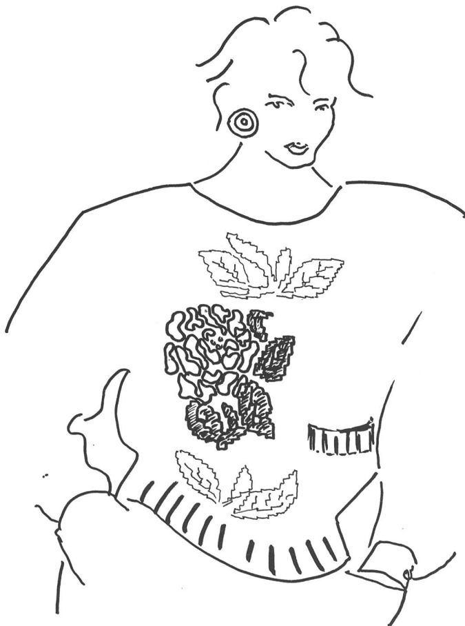
Abb. 3 und 3a: Intarsien-Mustermix, Blumenmotiv. Die Tasche wird gleich mit eingestrickt