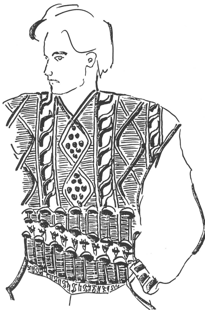
Abb. 6 und 6a: Struktur-Mustermix mit keilförmig angeordneten, geöffneten Wellen. Im oberen Bereich ein Aranmotiv. Hohe Produktion durch variablen Hub; die Wellen werden durch die Niederhalteplatinen sicher nach unten geführt. Ein Einstreifer ist bei der CMS nicht notwendig.