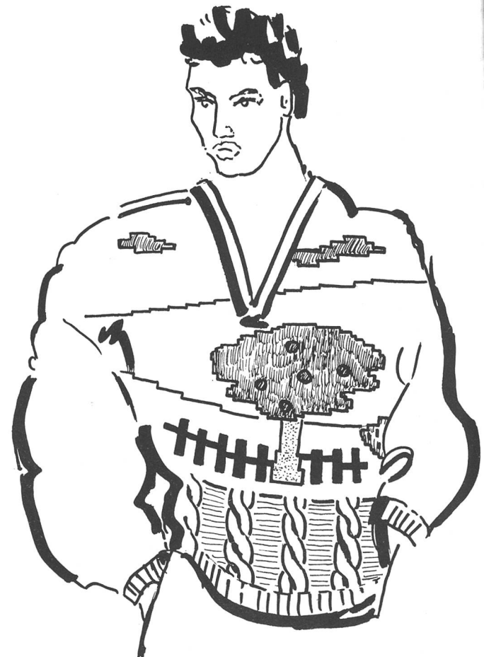
Abb. 4 und 4a: Bauernlook-Intarsien in verfeinertem Handstrickeffekt. Fangnoppen als Fruchtimitation im Baum. Modisch der Mustermix zwi- schen Intarsien und Zopf. Die Fangnoppen werden im Kurzhub gestrickt, deshalb kurze Laufzeiten.

Die CMS beherrscht alle Intarsienarbeitsweisen, alle Verbindungen mit Durchbrüchen, die bekannte Doppelmaschenbindung und als Besonderheit die schon angesprochene Intarsien-Fangbindung. Ein Fanghenkel auf der Gestrickerück-