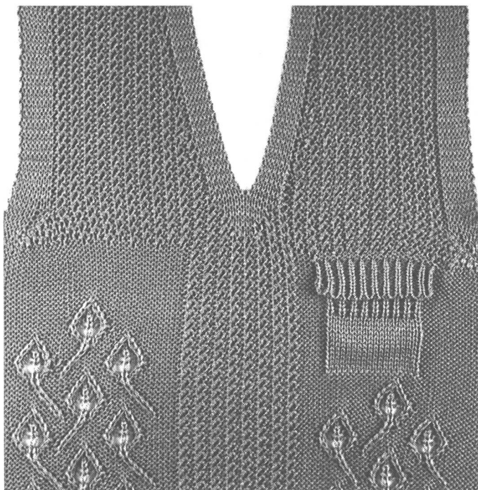
Abb. 7: Formgestricktes Strukturvorderteil mit Flapptasche 1:1. Tasche und Taschenklappe werden im variablen Hub gleich mit angestrickt. Wesentliche Einsparungen an Garnmaterial, Lauf- und Konfektionszeiten.

Der Rundhals wird von der CMS regulär gestrickt, dies ist auch für die Schulterschrägen gegeben. Einige führende Maschinenwarenersteller fertigen bereits jetzt so Strickteile, die nicht mehr zugeschnitten werden müssen und deshalb durch ihre flache Naht einen hohen Konfektionsstandard erreichen. Für solche hochwertigen Maschinenwarenersteller sind gute Marktchancen gegeben.