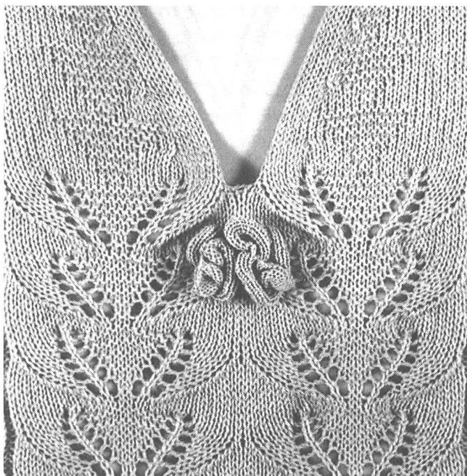
Abb. 1: Orchideen-Applikation, wie sie die CMS direkt anstrickt. Der Schlitten läuft dabei nur über die Nadeln, die arbeiten.

Nachdem auch die wichtigsten Faserhersteller und Spinnereien aus Italien, Frankreich, Belgien, Grossbritannien und Deutschland als Garntendenz für das nächste Jahrzehnt hochwertige Garne vorschlagen, ist Formstricken künftig ein