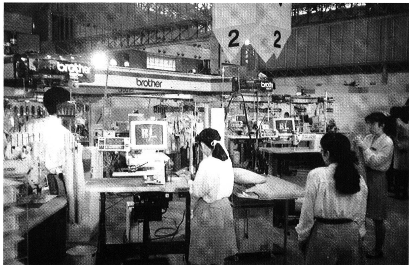
Bereichsübergreifende Thematik: Trend zur Gesamtlösung. Hier TAS-Brother/Lectra an der JIAM '90.

Die Legetechnik ist ebenfalls ein Thema. Hier bietet sich eine breite