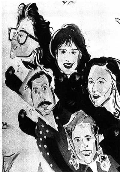
Das Dornbirner Unternehmen Rhomberg Textil scheut sich nicht vor neuen Umsetzungsformen von Kunst und Design. Das Creativ-Team aus der Sicht des britischen Karikaturisten Peter Clark.

Die vom 9. bis 11. April abgehaltene Interstoff zeigte in ihrem Besucherprofil eine klare Nationalisierungstendenz mit starker Ausrichtung auf das Gastgeberland Deutschland, aber auch Skandinavien. Trotz der Bemühungen,