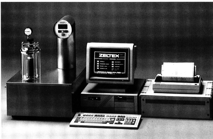
Colostar CS3 + Zelmoni

Als Universal-Laborfärbeapparat findet der Polycolor seinen Einsatz im Betriebslabor und eignet sich bestens zum Erarbeiten von Rezepturen bis 135° C Färbetemperatur für alle Faserarten in Form von losem Material, Garn im Strang, Stückwaren sowie für konfektionierte Artikel.