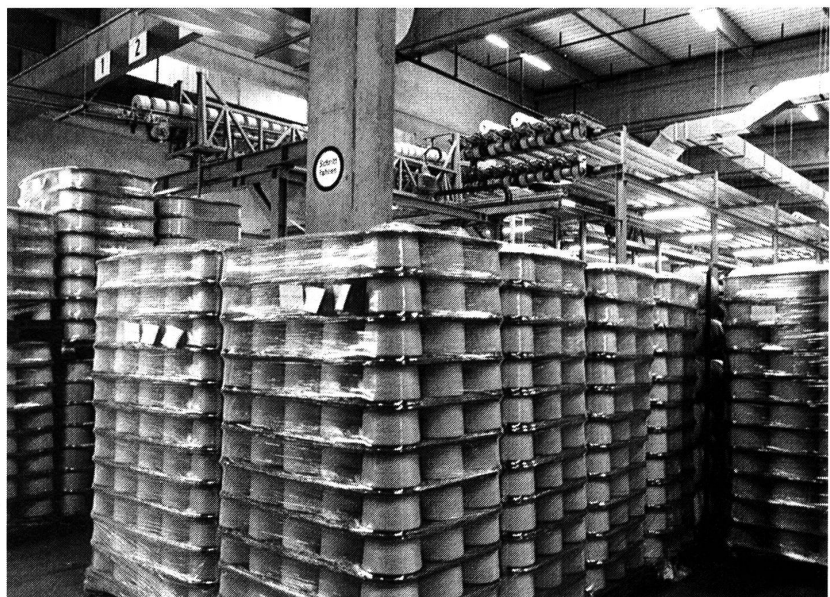
Kreuzspulenspinner im Autoflow-System

Im Anspinnwagen aller Autocoro-Typen zeigt Schlafhorst das PC-basierte Diagnosesystem Corosult Anspinnen. Dieses Informationssystem schlägt