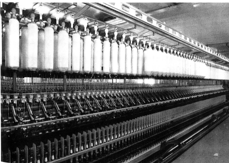
17 neue Rieter-Ringspinnmaschinen G5/2 mit 20 000 Spindeln stehen im vertikalen Direktverbund mit 17 Murata-Spulmaschinen.

Ein wichtiges Ziel der Erneuerung der Anlagen bestand darin, die Qualität der Baumwollgarne nochmals zu verbessern. Die neuen Anlagen haben diesen Beweis bereits erbracht, und die Garnwerte wurden wenige Wochen nach Installation der neuen Anlagen weiter verbessert. Die Stärke der Spinnerei