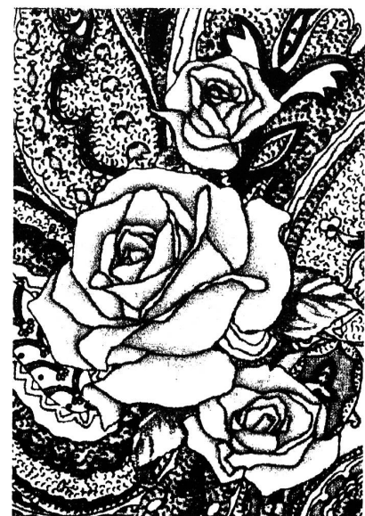
N.T.-Treepaint-Colorsystem: 262 000 Farbstellungen

Der italienische Systemanbieter «N.T. – New Technologies» verfügt im Bereiche der Erstellung von Druckmustern und deren Colorierung («Treepaint») über eine Bildschirmauflösung von 65 000 × 65 000 (!) Bildpunkten