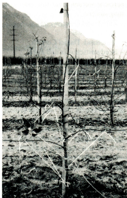
Polypropylen-Bast in Walliser Obstkulturen

Durch den gezielten Einsatz von speziellen Additiven hat AROVA Schaffhausen einen neuen, unter Lichteinfluss abbaubaren Baumbast entwickelt. Damit werden verschiedene Probleme bei den Hochleistungs-Niederstammkulturen wie Apfel- und Birnenkulturen