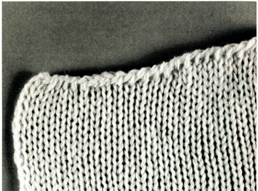
Die Flachstrickmaschine kettelt Formstrickteile ab, so dass diese rundum mit festen Kanten konfektionsfertig aus der Maschine kommen.

Bei Integral-Pullovern entfallen die Konfektionsgänge Vorbügeln, Zuschneiden und Ketteln der Halseinfassung. Taschen werden eingestrickt. Bei den Jacken auch die Knopflöcher an den Besätzen. Bei der Konfektion der Pullover sind praktisch nur noch zwei Seitennähte zu schliessen.