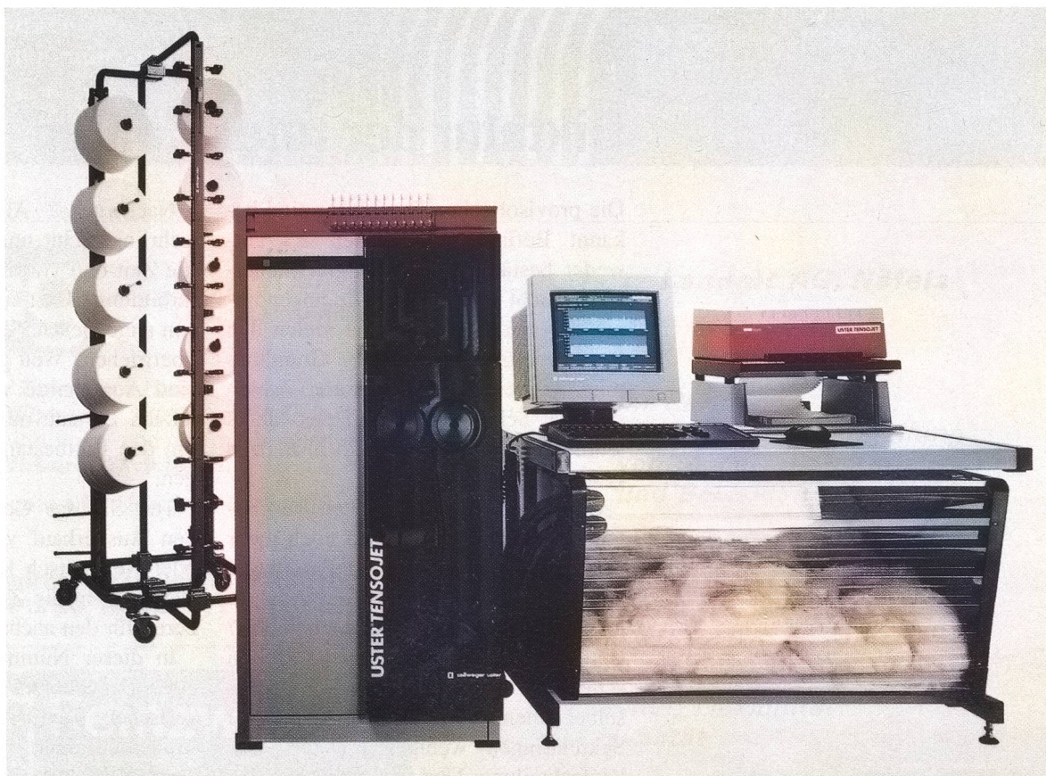
Digitale Hochleistungs-Zugprüfanlage Uster Tensojet

Mit Tausenden von Zugprüfungen in kürzester Zeit liegt eine genügend hohe Anzahl praxisbezogener Resultate über Schwachstellen im Garn vor. Daraus lassen sich Voraussagen über die Weiterverarbeitungsbedingungen ableiten und festigkeitsbedingte Fadenbrüche auf Webmaschinen werden abschätzbar. Die Hochleistungs-Zugprüfanlage von Uster wird dadurch auch zur inter-