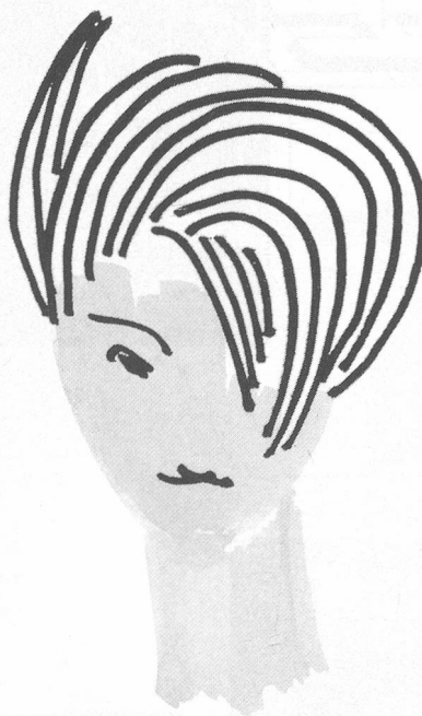
Schillernd strukturiert experimentell erforscht