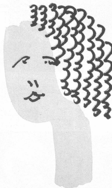
Traditionell gekräuselt futuristisch kombiniert

Wir sind die erfolgreichen Zwirnstylisten!