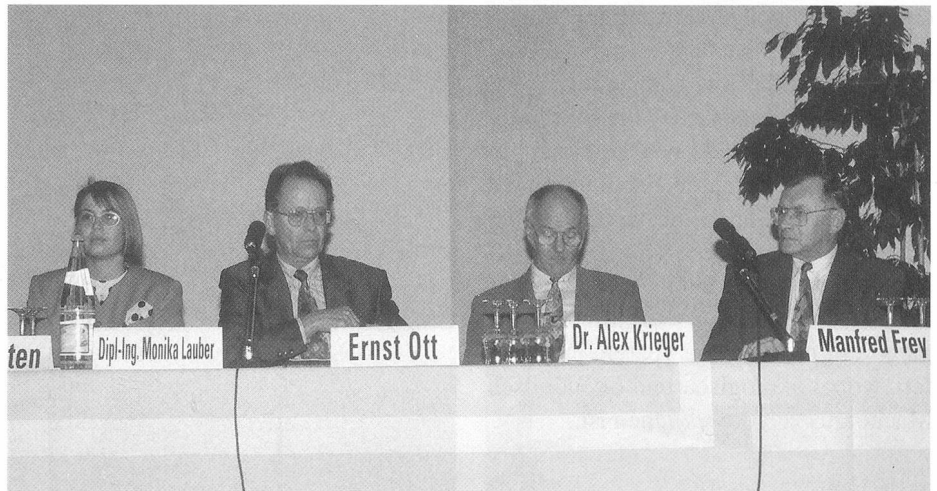
Die Referenten zum Thema: Faserstoffe und Garne

OE-Rotorgarne werden für die Maschenwarenherstellung bereits im grossen Mass verwendet. Ihr Einsatz wird sich ausbreiten. Das Institut für Textiltechnik der RWTH Aachen beschäftigt sich daher intensiv mit der Analyse sowohl des OE-Rotorspinnprozesses und der Struktur der Garne als auch der Korrelation zwischen Garnstruktur und der Qualität der hieraus hergestellten Maschenwaren. Zur objektiven visuellen Bewertung von Maschenwaren findet ein Bildanalyseverfahren Anwendung. Der Fortschritt in der digitalen Bildverarbeitung ermöglicht es, heute die subjektive visuelle Beurteilung der