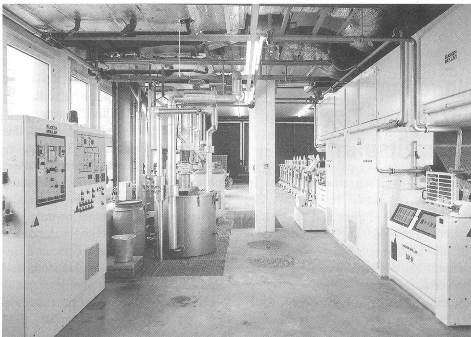
Schlichtekoch- und Überführungsanlage

verfahren geschlichtet. Durch die Staubabsaugung im Trockenfeld konnte eine Verbesserung des Raumklimas erreicht werden.