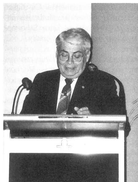
Prof. A. Dodu, Romanian General Assoc. of Engineers, RO

Dodu, A.: Medizinischen Textilien für Implantate. Zu den vorgestellten medizinischen Textilien zählen Herzklappen, Gefässteile mit und ohne Verzweigungen, Verbandstoffe, chirurgische Einlagen, Nähfäden usw. Die erforderliche