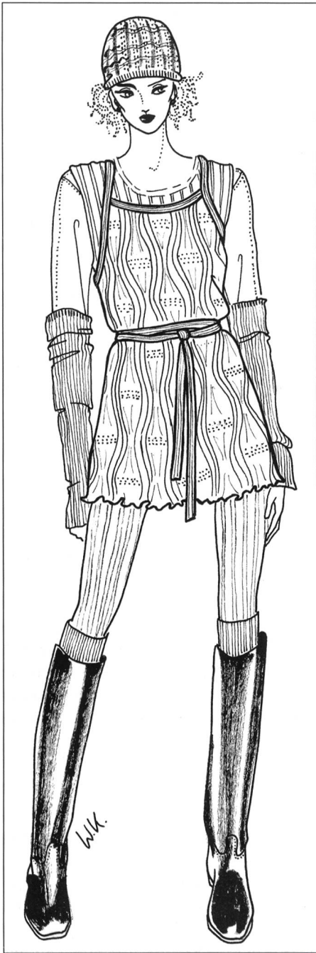
Modell Elementi Zeichnung: Wiebke Koch

durch kleine Westchen und gewickelten Tops über Kleider und Blusen, darunter Plisse- und Godetröcke, romantisch und verspielt. Unterstützt wird Dornröschens Romantik von Materialien wie Pannesamt, Ausbrennerspitze und Ajourjersey sowie Dessins von alten Möbel- und Tapetenstoffen. Weiche Stoffe bestimmen den Tag, von Tweed über Mohair bis Samt.