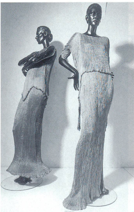
Mariano Fortuny (1871–1949), Italien. «Delphos», Seide, Venedig 1910/1930, Museum für Kunst und Gewerbe Hamburg.