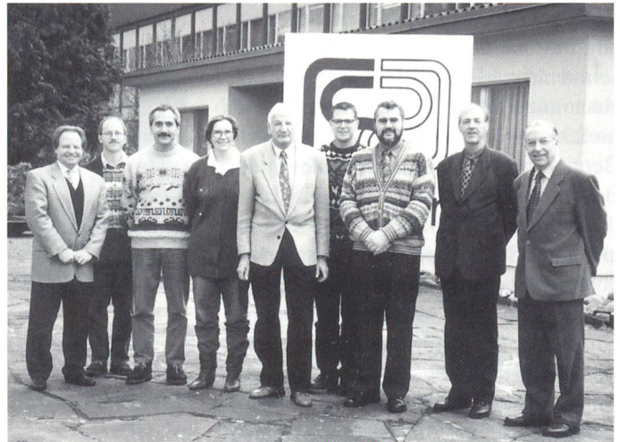
Die Kursteilnehmer mit Vertretern der Geschäftsleitung der Firma Steiger

mehrerer Tage eingearbeitet und ausführlich getestet. – Bei der Montage konnte man auch die spezifischen, konstruktiven Besonderheiten kennenlernen. Die Firma Steiger ist für ihre unkonventionellen, einfachen Lösungen bekannt. Eine Exklusivität ist der direkt unter den Nadelbetten angeordnete Warenabzug mit zwei angetriebe-