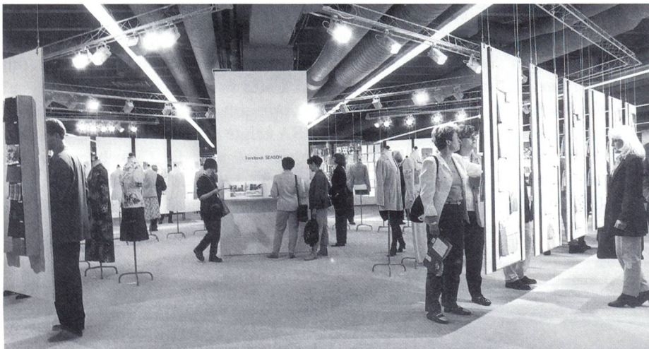
Trend focus auf der Interstoff Season Frühjahr 1996

Die Ausstellerbeteiligung der Produktgruppen Stoffe und Textilien entsprach nicht den Erwartungen des Mesveranstalters.