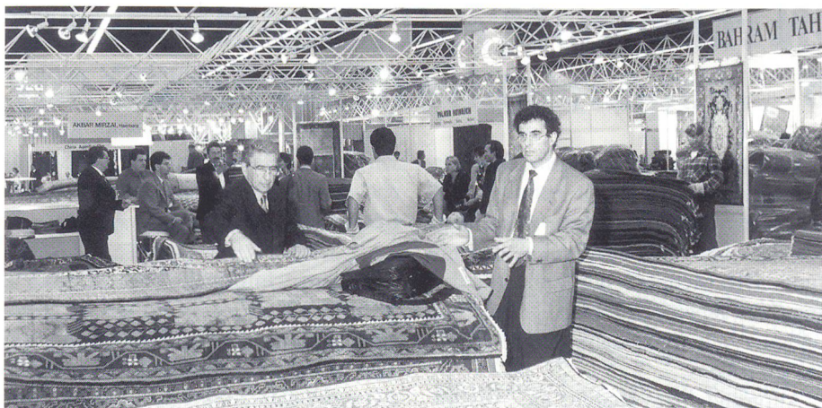
Ein Streiflicht von der EUROTEFA '95

Der Verbraucher kann sich am Computerbildschirm im Einzelhandesgeschäft seinen Teppichtraum erfüllen.