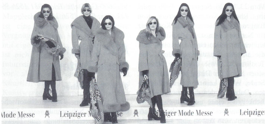
Leipziger Modemesse Februar 1996

Im Congress Center Leipzig (CCL) finden 2600 Personen Platz. Sieben Säle und 14 Tageslichträume – alle voneinander unabhängig, aber miteinander kombinierbar – stehen hier zur Verfügung. Mit einer Konferenztechnik, die von der datentauglichen Video-Grossprojektion