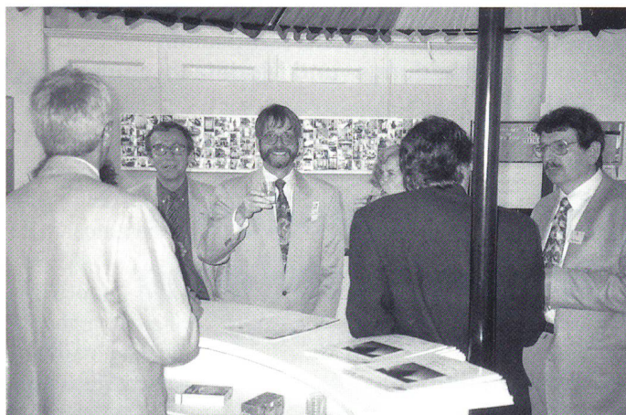
An der SVT-Bar standen «erfahrene Hasen» für die Mitglieder gewinnbereit