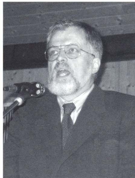
Präsident des Textilverbandes Schweiz: Urs Baumann

Deutlich mehr Teilnehmer als im letzten Jahr durfte Urs Baumann auf der Halbinsel Au begrüßen. Die berechenbaren Wellenbewegungen in den 70er Jahren und 80er Jahren, in denen einer schwachen Konjunktur immer ein Hoch gefolgt ist, sind vermutlich vorbei. Die schweizerische Textilindustrie befindet sich heute in einem tiefgehenden strukturellen Veränderungsprozess, der ganz anderen Gesetzmässigkeiten unterliegt, als der Folge von schönem und schlechtem konjunkturellem Wetter. Veränderungen, die dazu führen werden, dass sich die wirtschaftliche und gesellschaftliche Landschaft noch gewaltig verändern wird. Veränderungen, die aber auch gewaltige Chancen beinhalten, die die Textilindustrie nutzen muss.