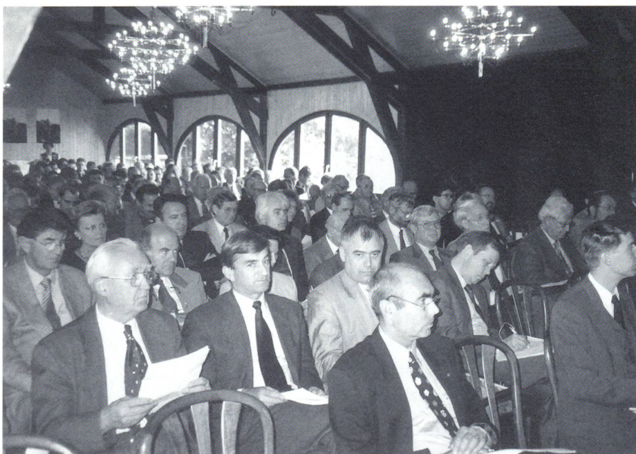
Ein gut gefüllter Saal