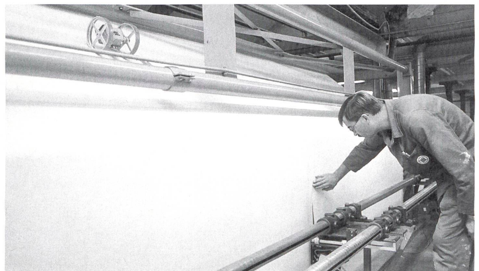
Die Produktion bei der Technische Textilien Lörrach GmbH

Die Reihe der Softwareprodukte des Weinheimer Softwarehauses für den Fachhandel wurde mit dem System SDS telecam erweitert. Die neue Software deckt den Aufgabenbereich der Präsentationskontrolle aus der Entfernung ab. Vorbei ist die Zeit, wo der Filialcontroller laufend die einzelnen Be-