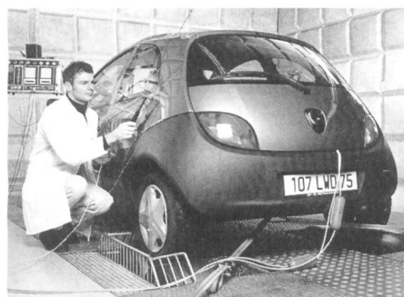
Akustische und schwingungstechnische Untersuchungen bei Rieter Automotive Systems

Positiv entwickelt sich auch das Wachstum für die Maschine SPT, die nun bereits im zweiten Jahr im Webma- schinenwerk in China montiert wird.