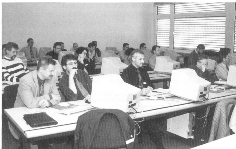
Die Teilnehmer am Weiterbildungskurs

Deshalb ist es sehr wichtig, dass sich eine Firma, welche sich mit dem Gedanken beschäftigt aufs Internet zu gehen, seriös darauf vorbereitet. Welche Produkte und Dienstleistungen sollen angeboten werden, welche Informationen sollen auf der HomePage dargestellt werden, wie soll die HomePage gestaltet werden, wer soll angesprochen werden (Zielgruppen) und wer betreut, pflegt und unterhält die Home-