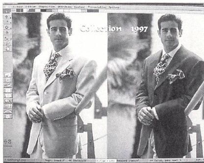
Dreidimensionale Darstellung eines Herrensakkos

Wird ein Stoff entworfen, kann er auf Diskette originalgetreu mit den exakten Farbnummerangaben gespeichert und an den Produzenten weitergegeben werden. Diese Materialien, wie zum Beispiel Strick, kann wie bei Gerber in einem Muster gestylt und danach in den verschiedensten Farbkompositionen zusammengesetzt und dann in das Modell eingesetzt werden.