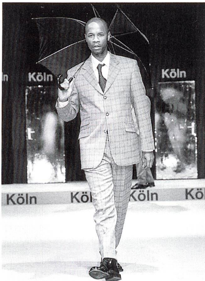
Land in Sicht

Ein «Silberstreif» zeichnet sich am Horizont der Männermode für den Herbst/Winter 1998/99 ab, die vom 6. bis 8. 2. 1998 in Köln auf der Herrenmodewoche gezeigt wurde. Und das gleich in zweifacher Weise. Zum einen konnte nach langer Zeit wieder ein Plus bei den Verkaufszahlen verzeichnet werden, angeblich um die 6%. Zum anderen in der Farbpalette – wobei der Silberstreif doch dann meistens in ein sehr tristes Zinngrau bis sehr häufig Schwarz abdunkelte. Eher ins Abseits gedrängt ist die Blaupalette, die wenn, auch nur die dunklen Abstufungen präsentiert. Schon in der letzten Saison angeboten wurde die Braunskala, doch konnte die sich bis jetzt nicht beim deutschen Mann durchsetzen.