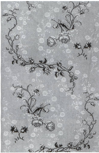
Weissgrundige Seide mit Rosen und Rosenknospen angeordnet in der wellenlinienförmigen «Line of Beauty», England, ca. 1744–1746.

die im 18. Jahrhundert so reichen Spitzen, die dann von der Weberei aufgenommen wurden.