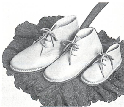
Der Rhabarber-Schuh ist in Kinder-, Frauen- und Männergrößen erhältlich und kostet 139.–, 239.– bzw. 259.– Franken. Zu bestellen ist er bei hess natur , Postfach, 4901 Langenthal oder unter Tel. 062 / 916 20 20.

werden müssen. Der klassische Family-Boot im hellen Naturton besticht durch sein weiches Leder und die robuste Verarbeitung, was einen angenehmen Tragkomfort garantiert. Die natürliche Behandlung bringt es mit sich, dass das Leder eine schöne Patina bekommt. Dieser Schuh kann zu einem wahren Freund werden. Künftig will hess natur noch weitere Schuhmodelle aus dem einzigartigen Rhabarber-Leder in seinem Sortiment anbieten.