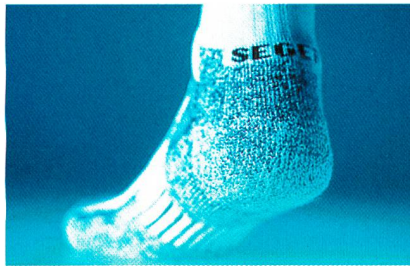
Abb. 1: Blister Guard™ Socken

Da es für die Ermittlung der Reibungswerte in Socken bisher keine standardisierte Testmethode gab, wurde das für Materialuntersuchungen renommierte EMPA-Institut in St. Gallen mit der Ausarbeitung eines Prüfdesigns betraut. Die Methode zur Überprüfung der Reibungswerte von Socken orientiert sich an bisher gängigen Verfahren zur Reibungsermittlung und simuliert Durchschnittswerte, die bei Laufbewegungen anfallen (Masse/Druck, Belastungsfrequenz). Die Proben werden mit einem genau definierten Druck auf einem beweglichen Schlitten über einen der menschlichen Haut ähnlichen Kunststoff hin- und herbewegt und die dabei entstehenden Reibungswerte computergestützt ermittelt (Abb. 3). Aus dem Vergleich der Messresultate für Gewebeprobe mit/ohne