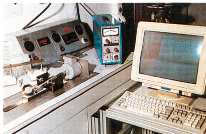
Abb. 3: EMPA-Prüfgerät zur Ermittlung der Reibung von Socken

Die Testergebnisse werden in einer Datenbank von PTFE, LLC gespeichert und geben Aufschluss darüber, wie sich die Reibung eines bestimmten Sockentyps unter Berücksichtigung der Materialien, Anteil der TEFLON® Faser und Stricktechnik verbessern lässt. Damit soll für jede Art von Socken die ideale, reibungsarme Mischung gefunden werden. Auf der Grundlage der fortlaufend durchgeführten Testmessungen können wichtige Informationen darüber ermittelt werden, wie durch Einsatz der TEFLON® Faser und durch die richtige Auswahl bestimmter stricktechnischer Parameter Socken mit