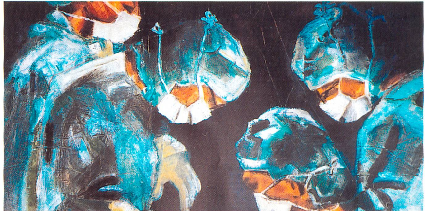
Praxisnaher Auftritt der Löning Hospitex GmbH, Hamburg

Herstellerseite gaben mehrere Referate Auskunft über Aufbau, Charakterisierung und Zulassung textiler Produkte.