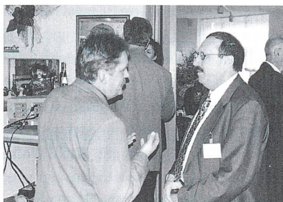
Unser Autor beim Fachgespräch während einer Tagungspause

In unserer Industrie kennt man mich als Verfechter von Schnittstellen und ich verfolge immer wieder dieselbe These, dass nur transparente Schnittstellen es ermöglichen, Friktionen zwischen den einzelnen Verarbeitungsschritten zu vermeiden. Die immer weitergehende Vernetzung von Unternehmen, wie beispielsweise «Virtuelle Fabriken», zwingen uns, Gedanken darüber zu machen. Die Maschinenbauer sind uns etwas voraus, indem sie bereits früh schon Normen eingeführt haben. Jeder Maschinenbauer weiss, was unter einer M8-Schraube oder einer H0-Bohrung zu verstehen ist. Bestimmt haben wir aufgeholt und setzen auch Normen ein, doch gibt es noch manche Gebiete, welche es noch zu erforschen gilt. Ein Projekt, welches