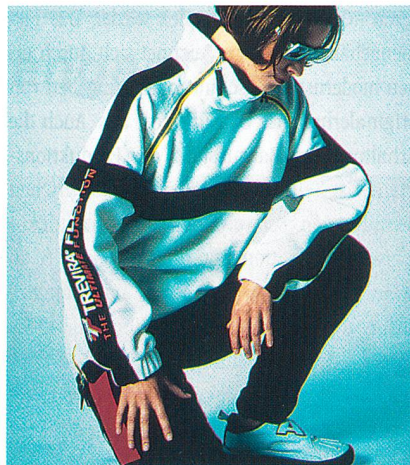
«Husky Swisspile» – die neuste Fleece-Qualität der Chr. Eschler AG, Bühler/CH Modell: JAS Creationen – Joseph Alain Scherrer

Als 1989 «Faser-Fleece» in Europa ein Thema wurde, setzte die Chr. Eschler AG in Bühler/CH für ihre Marke «Husky» vom Start weg auf Trevira Polyester und zählt heute zur Spitzengruppe der weltbesten Fleece-Erzeuger. Die enge Partnerschaft mit Höchst Trevira hat sich in den verflochtenen 10 Jahren bewährt. Gemein-