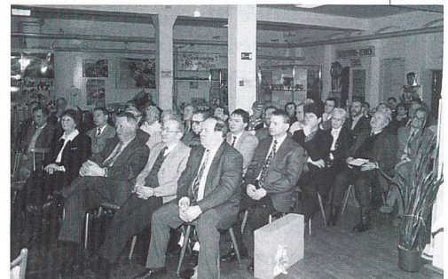
Teilnehmer des Meetings inmitten eines Austellungsraumes des Museums

Aus diesen beiden Anlässen fanden sich ehemalige und gegenwärtige kompetente Mitstreiter für Malimo aus Wissenschaft, Forschung, Entwicklung und Industrie zu einem Gedenkmeeting im Textil- und Heimatmuseum in Hohenstein-Ernstthal zusammen. Die Veranstaltung stand unter dem Motto «Eine Idee lebt».