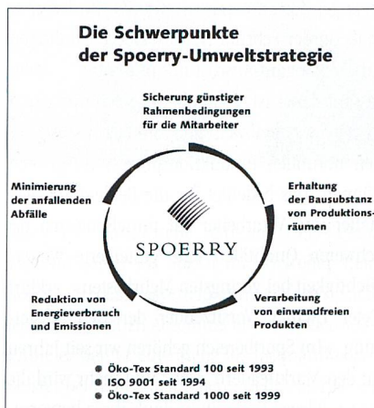
Die Schwerpunkte der Spoerry-Umweltstrategie

Weiter sind Humanökologie am Arbeitsplatz und der gänzliche Verzicht auf Kinderarbeit Bedingungen für die Zertifizierung. Die Erfüllung der Standards wird von den unabhängigen Instituten der Internationalen Gemeinschaft für Forschung und Prüfung auf dem Gebiet der Textilökologie regelmässig überprüft.