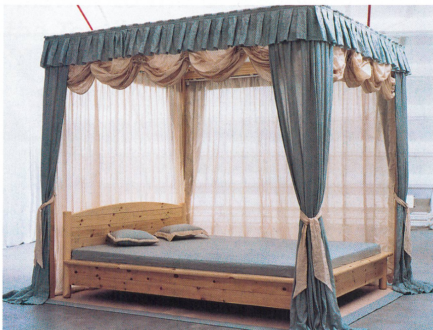
Swiss Shield® Bettbaldachin und Teppich zur Abschirmung elektromagnetischer Strahlen im Schlafbereich.