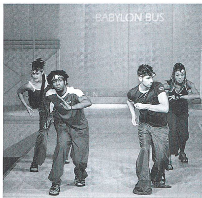
Street Vibes Show

Gelb blitzte auch häufig bei den Kollektion auf der CPD in Düsseldorf vom 1. bis 4. 8. 1999 auf. Bei manchen Kollektionen wie Nicowa oder Joseph Janard wurde überhaupt kräftig im Farbtöpf gerührt. Himbeer, Weiss, Grün und Terracotta wurden ebenfalls auf die sehr femininen Kol-