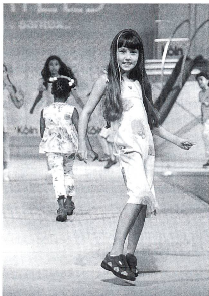
Modeschau Kids On Stage

Im Strickbereich dominieren Troyer- und kurze V-Kragen. Leider ist auch hier für die Jungen die Grauarie angesagt, sehr unsicher im Strassenverkehr. Kräftige Strukturen bleiben wichtig, wobei der Zopf abnimmt. Ein Comeback erleben Strickjacken, kurz für die körperengen Varianten und lang für die Hippie-Modelle der guten alten Flower-Power-Generation. Martina Reims