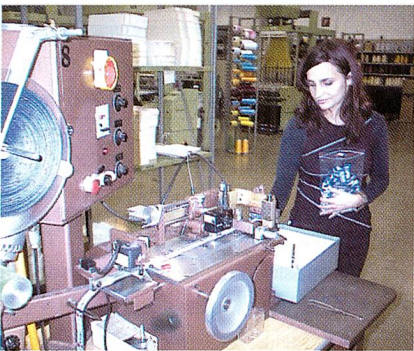
Mitarbeiter des Produktionsteams

muss erkennbar und aufeinander abgestimmt sein. Optimale Präsentationen vermitteln eine harmonische Botschaft, bei der das Image des Produktes durch das Etikettenkonzept identifiziert, zugeordnet und hervorgehoben wird. Eine aufeinander abgestimmte Kombination aller Elemente sind für den Erfolg ein Muss.