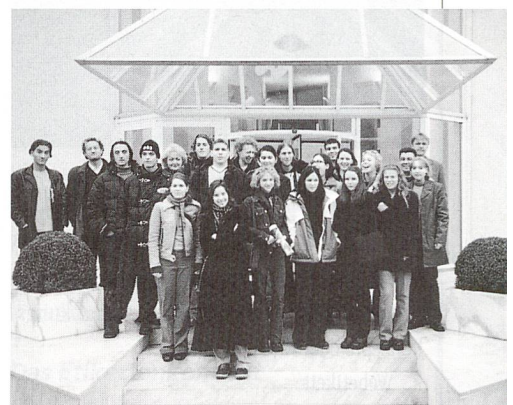
Die Teilnehmer der Nachwuchsexkursion bei Creation Baumann, Langenthal