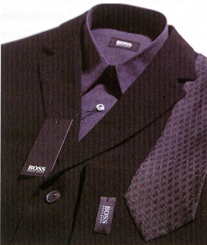
Etikettenkonzept für HUGO BOSS

muss erkennbar und aufeinander abgestimmt sein. Optimale Präsentationen vermitteln eine harmonische Botschaft, bei der das Image des Produktes durch das Etikettenkonzept identifiziert, zugeordnet und hervorgehoben wird. Eine aufeinander abgestimmte Kombination aller Elemente sind für den Erfolg ein Muss.