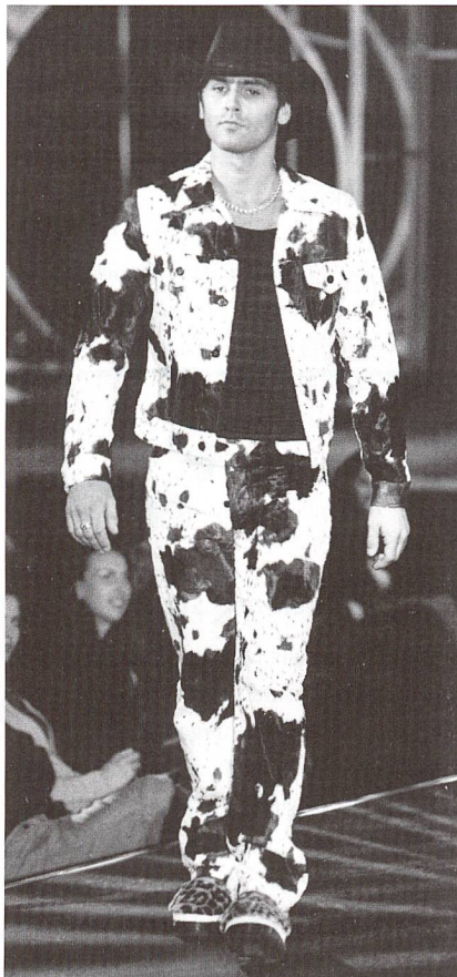
Das Büffellimitat für den anspruchsvollen Herrn

Bei den momentan herrschenden Temperaturen sind Confortemp-Materialien für lange Modelle sehr vorteilhaft, wie Wellington demonstrierte. Sehr praktisch sind auch Mäntel aus Japanwolle, eine 100%-ige Kofferware, die nicht knittert. Überhaupt wird hier viel gemischt. Die Zusammensetzung von PES, PA, Wolle und Elasthan sorgt für voluminöse, aber weiche Materialien. Cinque propagierte dagegen dicke haarige Bouclévarianten sowie super-