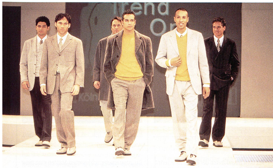
Trends auf der Herren-Mode-Woche in Köln

beer, Türkis und Orange war die ganze Farbpalette präsent. Besonders grob wurde die Maschinenwelt dargestellt. Grossspurig zeigten sich die Pullover und hatten einen hohen steifen, weiten Stehkragen wie bei Tom Tailor.